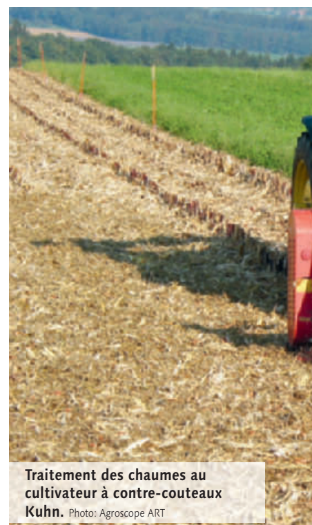
Traitement des chaumes au cultivateur à contre-couteaux Kuhn.

Dans la première série d'essais, la contamination moyenne des parcelles de contrôle était de 17%, celle des deux procédés de broyage atteignait 14%. La teneur DON des contrôles était de 4.9 ppm et avec 3.8 ppm (broyeur Kuhn) et 3.2 (broyeur Kuhn et rototiller), celles des deux procédés avec broyage restaient encore très élevées. Sur la totalité des échantillons de grains des parcelles de contrôle, 70% dépassaient la valeur limite alors que 52, resp. 56% de ceux des deux procédés avec broyage atteignaient cette limite. Pour la paille, la va-