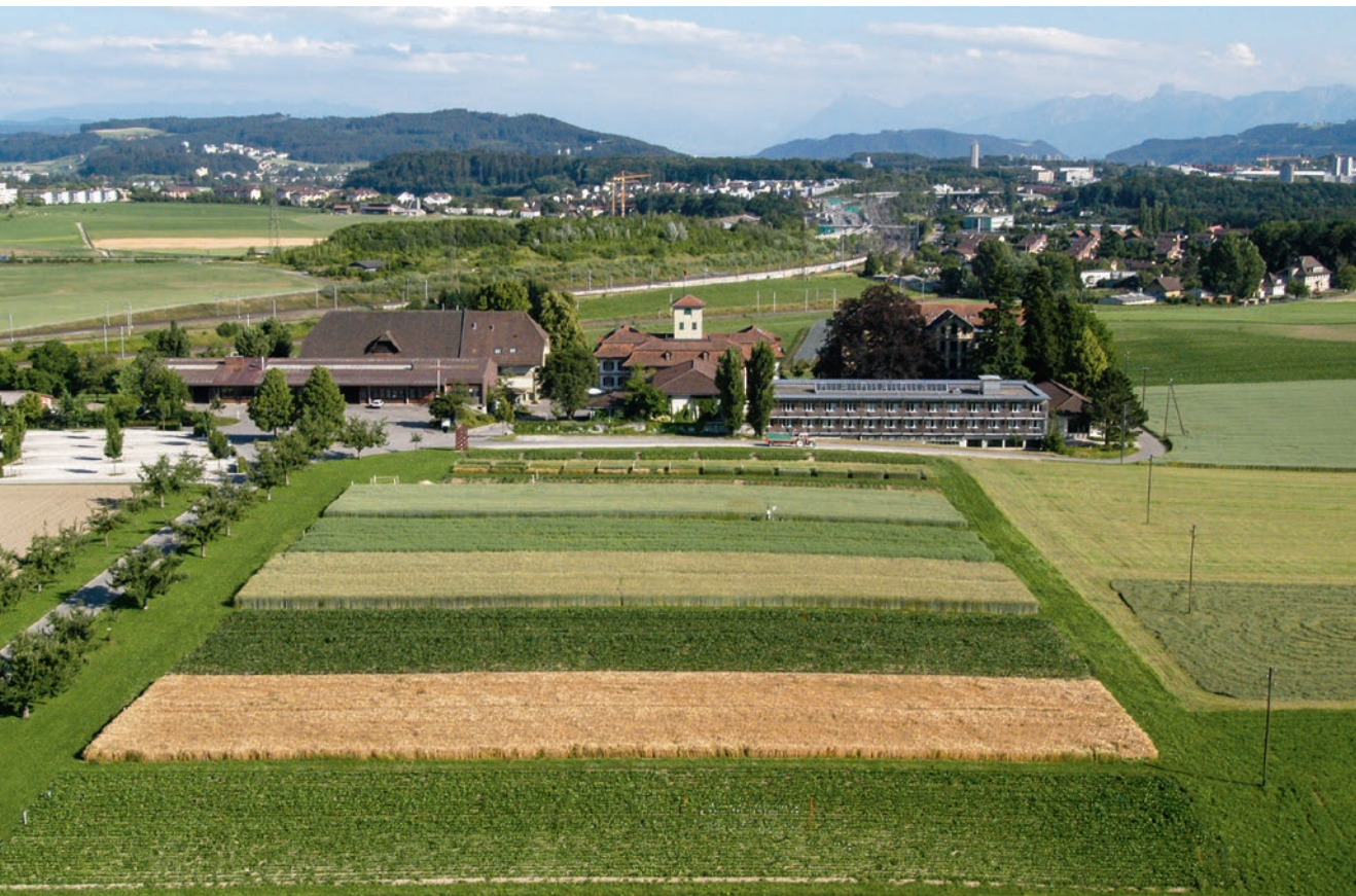
Figure 1 | Vue aérienne du site de suivi à long terme «Oberacker» de l'Inforama Rütli à Zollikofen (BE), juin 2004.

Renseignements: Claudia Maurer, e-mail: claudia.maurer@vol.be.ch