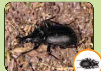
Cychrus caraboides 12 à 19 mm