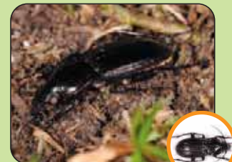
Abax parallelepipedus 18,6 mm