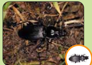
Pterostichus melanarius 15,7 mm