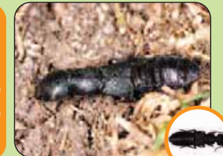
Ocyopus olens 22 mm