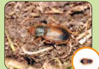
Diachromus germanicus 8,9 mm