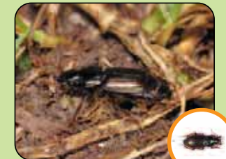
Harpalus affinis 10,2 mm