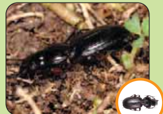
Steropus madidus 13 à 18 mm