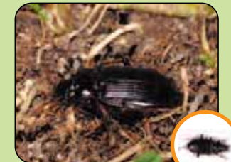
Nebria salina/brevicollis 10,2 à 13,2 mm