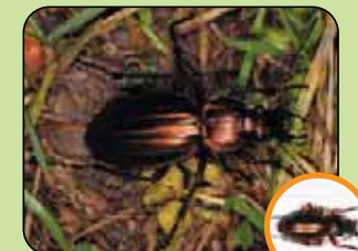
Carabus auratus 17 à 30 mm