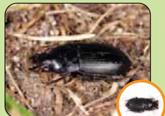
Harpalus dimidiatus 10 à 14 mm