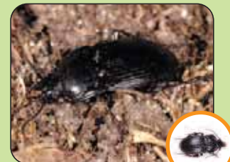
Abax ovalis 14,3 mm