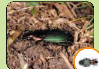
Poecilus kuguelani 13,8 mm