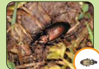
Poecilus cupreus 12,1 mm