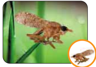
Euthycera arcuata 12 à 16 mm

Les auxiliaires présentés ici sont des insectes. Ce sont les alliés des agriculteurs car ils s'alimentent, entre autre, d'insectes nuisibles (pontes, larves et adultes) de limaces et de petits escargots... La plupart de ces prédateurs, que l'on rencontre fréquemment en France (et en Europe), appartient à l'ordre des Coléoptères. La famille qui compte le plus d'individus est celle des Carabidae . La famille des Scyomizidae (ordre des Diptères) est la moins fréquente sous nos latitudes ; elle a la particularité de parasiter les escargots en pondant ses œufs à l'intérieur des coquilles.