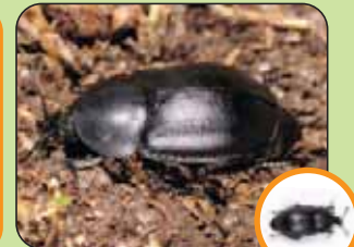
Ablattaria laevigata 13 mm