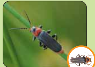
Cantharis rustica environ 19 mm