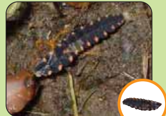
Lampris noctiluca environ 17 mm