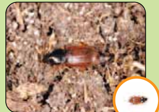
Parophonus mendax 6 à 10 mm