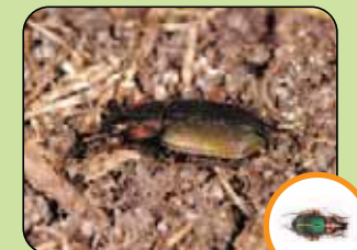
Chlaenius nigricornis 10,9 mm