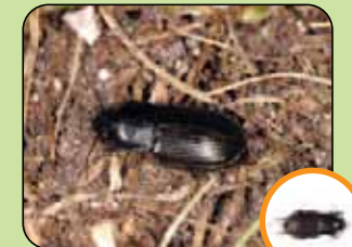
Anisodactylus signatus 12,5 mm