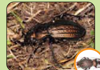
Carabus cancellatus 17 à 30 mm