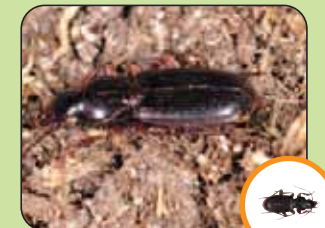
Pterostichus macer 13,3 mm