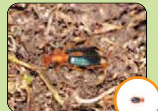
Brachinus sclopeta 5 à 7,5 mm