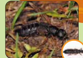
Staphylinus nigricornis 20 mm