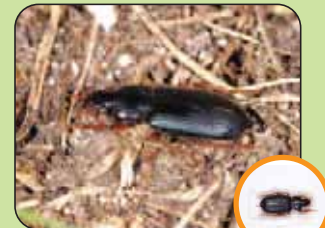
Ophonus rotundicollis 10 à 14 mm