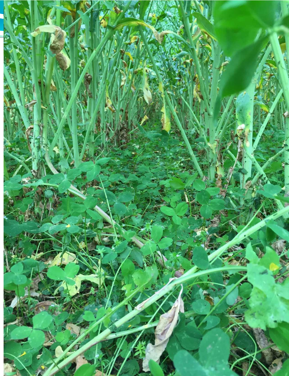
Photo de notre essai prise le 19 mai 2016 trèfle violet