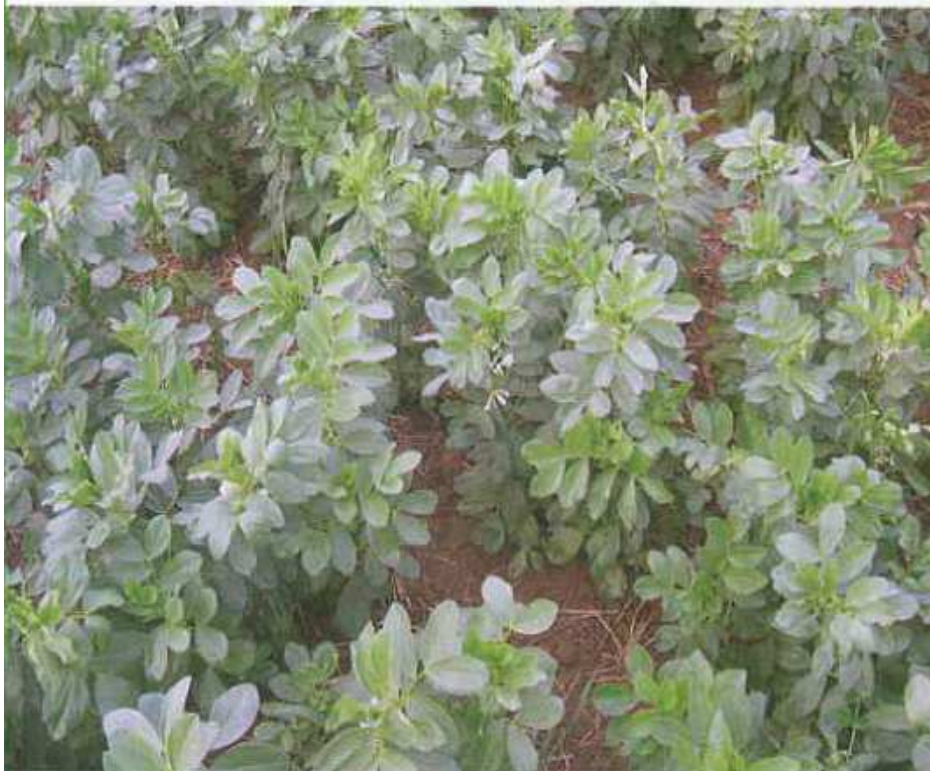
Fèverole 2 t MS/ha