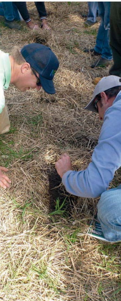
Les agriculteurs australiens considèrent cette idée innovante comme très prometteuse.