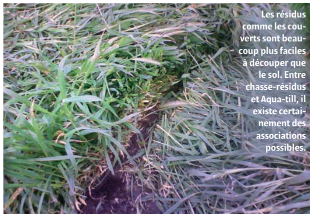
Les résidus comme les couverts sont beaucoup plus faciles à découper que le sol. Entre chasse-résidus et Aqua-till, il existe certainement des associations possibles.

Ce type de technologie pourrait trouver également une utilisation dans l'amélioration de la gestion des résidus sur un semoir à dents. Dans ce cas de figure, le jet serait dirigé vers l'avant pour découper les résidus et améliorer le flux afin d'éviter la formation de bouchons et limiter les risques de bourrages. L'utilisation de « cycles de nettoyage » réglables, similaire à la gestion des balais d'essuie-glace, autoriserait en plus une réduction significative de l'eau employée.